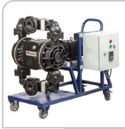
DP - 30E