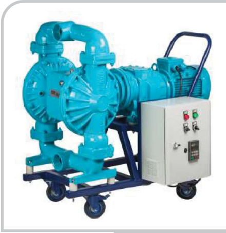
DP - 30E

Elektrikli Diyaframlı Pompalar / DP-30E Electromechanical Diaphragm Pumps / DP-30E