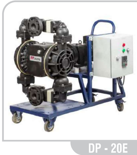
DP - 20E