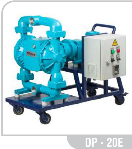
DP - 20E

Elektrikli Diyaframlı Pompalar / DP-20E Electromechanical Diaphragm Pumps / DP-20E